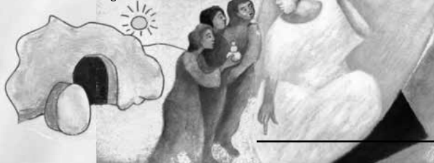
Hintergrund: Johannes Wianey Lehn, Friedbert Simon / Künstler: PolkaPop Ullrich, Blanka Leonhardt / www.kinder-regenbogen.at (in: Pfarrbriefservice.de)

Sollte es regnen gehen wir einen verkürzten Weg durch den Ort und enden am Jugendheim.